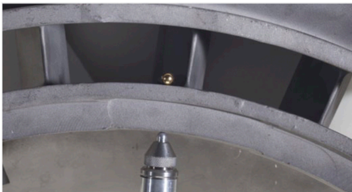
Mesure d'une pièce coulée de 24,1 mm de l'industrie aérospatiale

Le Magna-Mike a été intégré avec succès dans des programmes de contrôle qualité pour la mesure de pièces de matériaux composites et non ferreux de l'industrie aérospatiale. Il est possible d'insérer les fils dans les orifices de refroidissement des aubes de turbine. De plus, les billes plus grandes peuvent servir à mesurer les pièces des moteurs à réaction d'une épaisseur maximale de 25,4 mm.