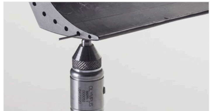
Mesure d'une aube de turbine à l'aide d'un fil