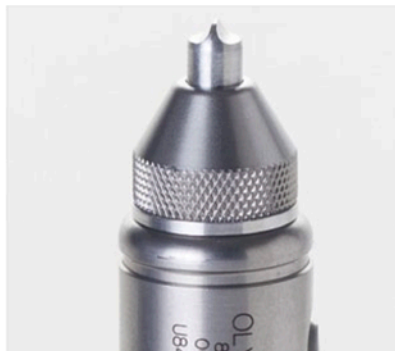
Embout à biseau