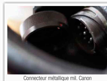
Connecteur métallique mil. Canon

Le GFC305 est un appareil panoramique portable dérivé de notre gamme réputée de Crawler mais conçu pour être opérationnel sur le terrain sans chariot mécanique. Ce générateur a donc hérité de la fiabilité de la technologie des crawlers Balteau NDT.